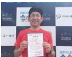
← (寝屋川ハーフマラソン 完走! タイム2時間30分58秒)

マラソンは府民の健康の保持・増進のための機会の提供はもとより、参加者同士の交流・友好の輪を広める場となります。10月30日開催予定の大阪マラソンをはじめ、今後計画されている「ラグビーワールドカップ2019」「東京オリンピック・パラリンピック2020」「関西ワールドマスターズゲームズ2021」など大阪の成長を牽引させる可能性がある事業を積極的に活用し大阪の発展につなげていけるよう引き続き、府に強く要望していきます。2月28日に開催された寝屋川ハーフマラソンでは5,000人を超えるランナーが駆け抜けました。