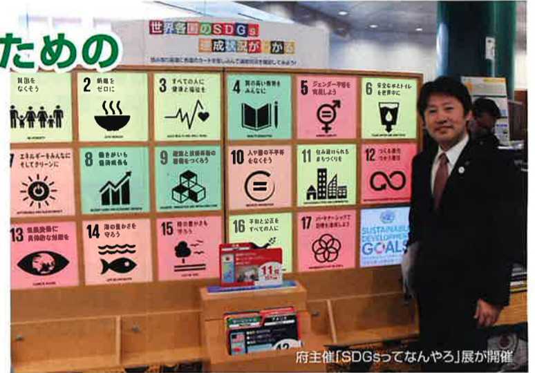
府主催「SDGsってなんやろ」展が開催

※SDGsとは…地球環境や経済活動、人々の暮らしなどを持続可能とするために、すべての国連加盟国が2030年までに取り組む行動計画。「誰も置き去りにしない」を共通の理念に、平等な教育、気候変動への対策など17分野の目標からなる。