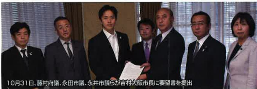
10月31日、藤村府議、永田市議、永井市議らが吉村大阪市長に要望書を提出