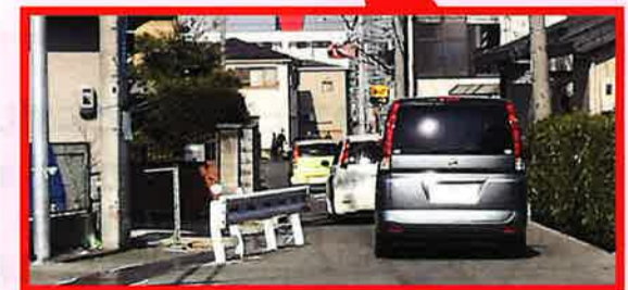
府道 枚方富田林泉佐野線