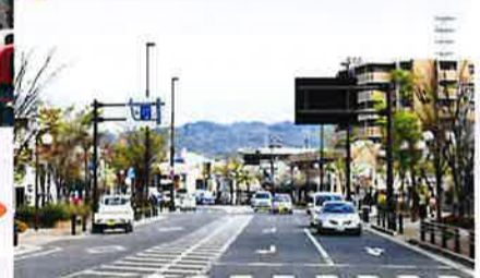
一部無電柱化された寝屋川駅前線沿道