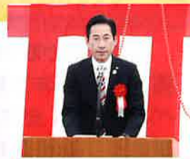
起工式で挨拶するひご府議

2月15日、高宮ポンプ場整備事業の起工式に出席。この事業は、大雨時における浸水被害の軽減を図るため、高宮ポンプ場並びに秦高宮雨水幹線を建設するもの。平成33年度の完成を目指します。これまで国に対し交付金総額拡大の予算要望を行ってきました。