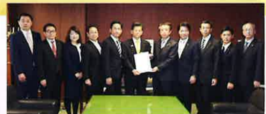
H29.12.8 石井国交相に予算要望