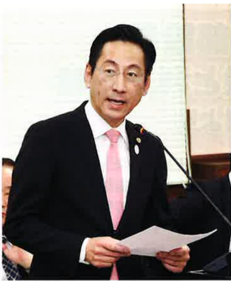
都市住宅常任委員会で質問するひご府議

浸水被害軽減に大きな効果を発揮する寝屋川北部地下河川は、鶴見立坑（守口市）～讃良立坑（寝屋川市）の区間が平成 27 年度末に完成し、貯留施設として暫定的に供用されています。