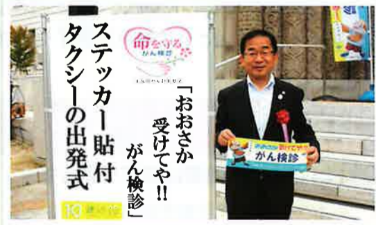
▲がん検診受診率50%をめざして(10月10日) がん検診受診を呼びかけるステッカー貼付タクシーの出発式が、大阪府庁本館玄関前広場で開催されました。

大阪国際がんセンターで開催された、大阪府初の「肝炎医療コーディネーター」養成研修会を視察しました。