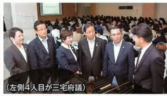
▲肝炎の重症化予防へ(10月15日)

大阪国際がんセンターで開催された、大阪府初の「肝炎医療コーディネーター」養成研修会を視察しました。