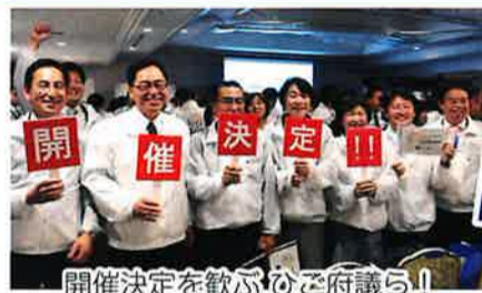
開催決定を歡ぶひご府議ら!

万博誘致の機運を高める取り組みとして、万博にかける夢や希望を子どもたちに描いてもらう「私の考える万博絵画展」を提案。全国から2000点を超える応募があり、多くの商業施設や駅などで展示され、機運醸成に多大な貢献を果たすことが出来ました。大阪・関西の発展のため、素晴らしい大阪万博となるよう、全力で取り組んで参ります。