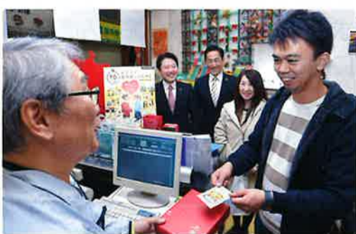
緑ジョイパスを利用する新婚カップル