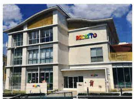
子育て世代包括支援センターが設置されている「リラット」

新婚世帯等に無料配布されている緑ジョイパスは府内の協賛店で、利用時にパスを見せると代金割引等のサービスがあります。また、府は民間企業と連携し婚活イベントを開催しています。少子化対策、子ども虐待の発生予防など重要な役割を担う子育て世代包括支援センターの府内の全市町村設置を求める質問を行いました。