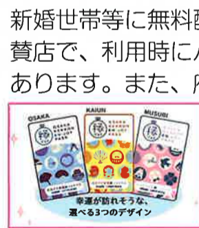
おおさか結婚緑ジョイパス

新婚世帯等に無料配布されている緑ジョイパスは府内の協賛店で、利用時にパスを見せると代金割引等のサービスがあります。また、府は民間企業と連携し婚活イベントを開催しています。少子化対策、子ども虐待の発生予防など重要な役割を担う子育て世代包括支援センターの府内の全市町村設置を求める質問を行いました。