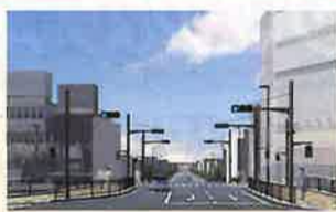
道路整備完成イメージ図

寝屋川市駅から西側へ延びるこの道路は、行き交う車と歩行者でひしめく、大変危険な道路。危険性を減らし住宅密集地の火災による延焼を防ぐために整備が進められています。電柱が倒れて住民の避難や緊急車両の通行に支障をきたさないよう無電柱化を進めます。