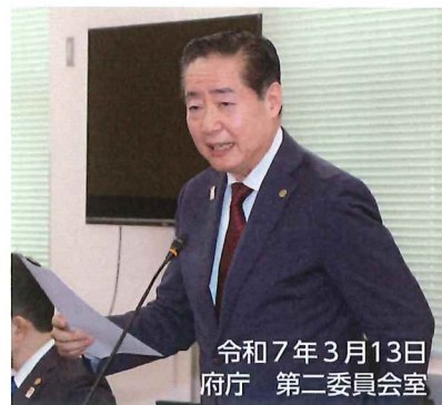
令和7年3月13日 府庁 第二委員会室

A 今後は、企業の好事例を集約し、高校生や大学生向けの就職支援セミナーにおいて、制度導入企業であることを示すロゴマークや制度導入企業を紹介するなど、あらゆる機会を通じて、導入企業のPRを強化していく